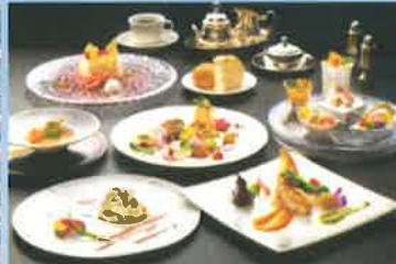
②フレンチ会席「フォーシーズン」