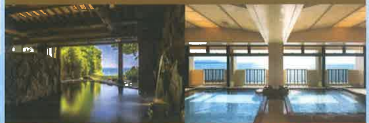
1階 露天風呂「縹」～はなだ～