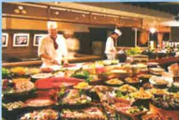
①阿波三味バイキング「彩」