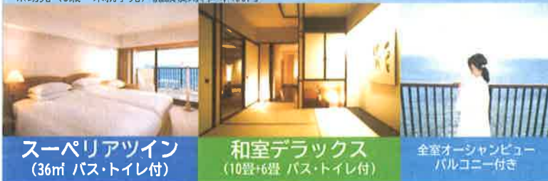
スーパリアツイン (36㎡ バス・トイレ付)

※小学生は大人2名1室料金の70% (和室デラックスは大人4名1室の70%) ※幼児 (3歳~未就学児) 施設使用料:4,400円