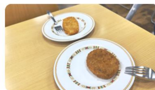
ピアノプレイヤーさん