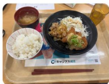
マクローリン展開さん