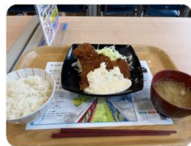
あなたの心にドストライクさん