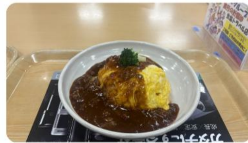
コーンポタージュさん