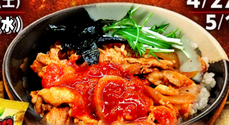
旨辛ビビンバ丼 (韓国)