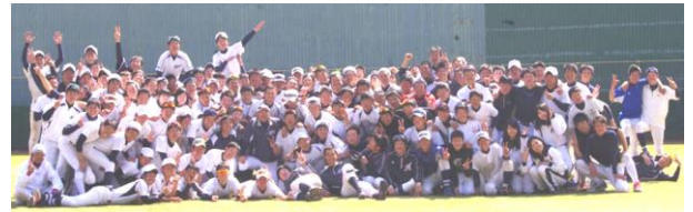
KANSAI BASEBALL TEAM