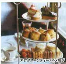
アフタヌーンティー/イメージ