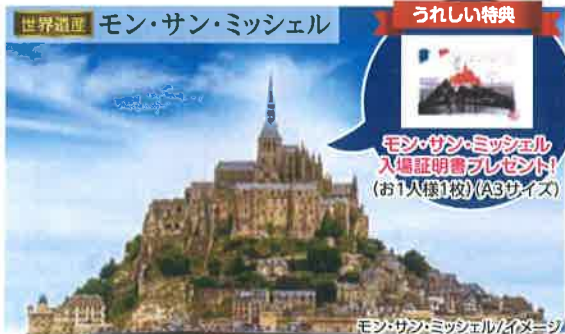
モン・サン・ミッシェル/イメージ

1300年の歴史を持つ世界遺産モン・サン・ミッシェル修道院。中世の面影を残す島内や対岸からの優雅で壮大な姿をお楽しみください。(注5・6)