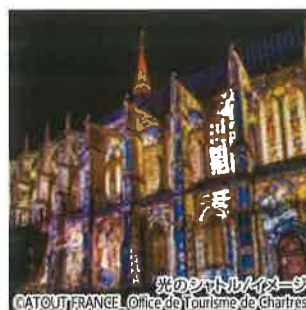
光のシャルトル/イメージ CATOUT FRANCE Office de Tourisme de Chartres

「睡蓮」で有名な「モネの家と庭園」を訪問! モネが晩年を過ごした家が花が咲く季節(4月~10月)のみ一般に公開されます。