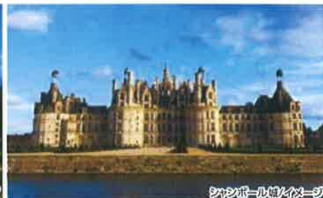
シャンボール城/イメージ

ロワール川流域に点在する21の城館のうち、2つの古城にご案内します。川に架かる橋のように建つ優美な佇まいの「シュノンソー城」、ロワール川流域最大の規模を誇る「シャンボール城」