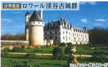
シャンボール城/イメージ

ロワール川流域に点在する21の城館のうち、2つの古城にご案内します。川に架かる橋のように建つ優美な佇まいの「シュノンソー城」、ロワール川流域最大の規模を誇る「シャンボール城」