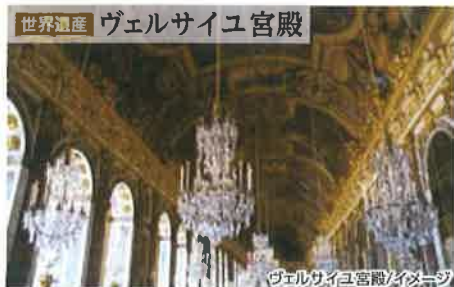
ヴェルサイユ宮殿/イメージ