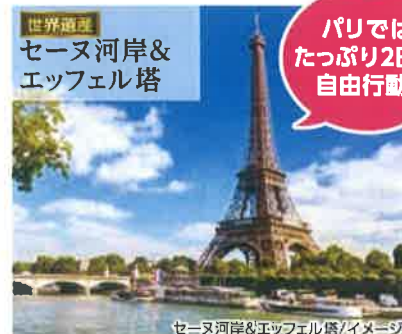
セーヌ河岸&エッフェル塔/イメージ