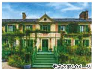
モネの家/イメージ