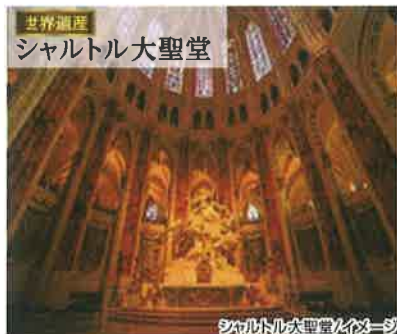
シャルトル大聖堂/イメージ