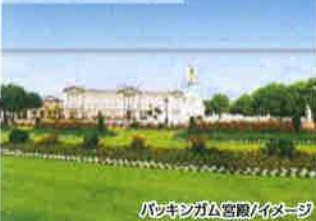
バッキンガム宮殿/イメージ