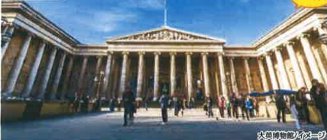
大英博物館/イメージ