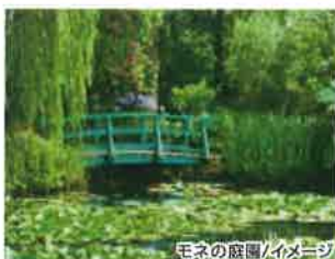
モネの庭園/イメージ