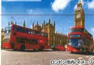
ロンドン市内/イメージ