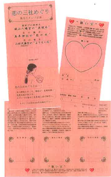
恋の三社めぐり スタンプ台紙

また、記念品が授与され、スタンプ台紙に“恋愛運上昇印”が押印されます。 (願い文は必ず記念品を受け取る神社へお持ち下さい)